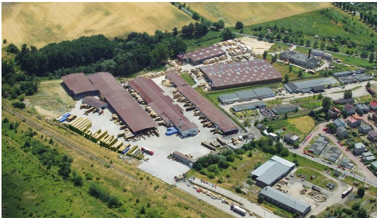
← Kozuchów (Polen)