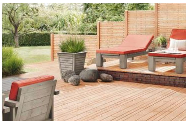
Haus und Garten