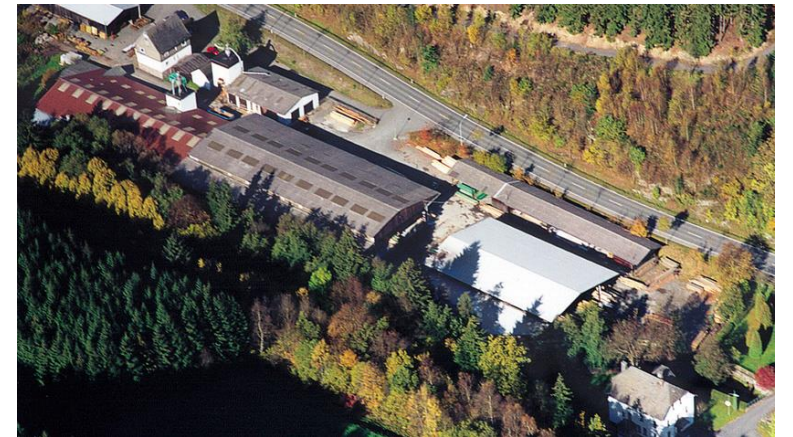
Winterberg/ → Züschen